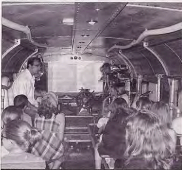
A l'aide d'un film, d'un questionnaire et d'une mini-exposition, le Capitaine Nemo sensibilise les enfants et les adultes aux enjeux du développement durable. Il est à Beaumont-le-Roger jusqu'à dimanche