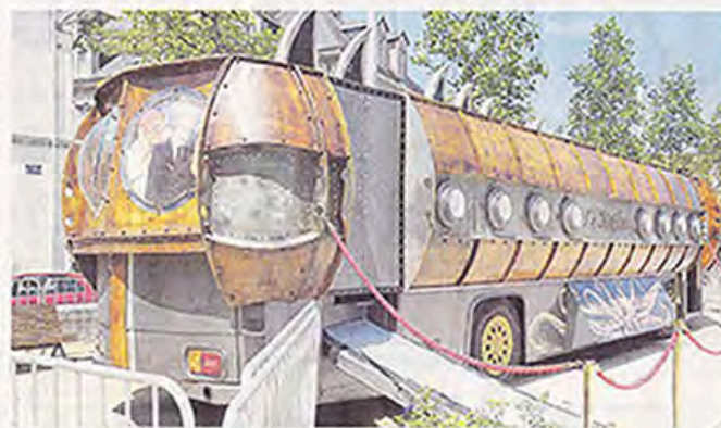
Sorti du fond des mers, le Notilus est devenu terrarium, place Ernest-Bréant.

Chaque séance, d'une durée 45 minutes, débute par le visionnage d'un film où l'on assiste au sauvetage d'un petit poisson par un marin, dans un monde sans eau. Les animateurs font ensuite partager à une