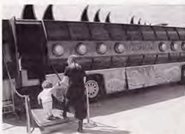
À l'intérieur comme à l'extérieur, le « Notilus » appelle au voyage et à la réflexion.

À bord, tout rappelle le sous-marin du capitaine Némé, avec des scaphandres, des commandes en bois et laiton et tous les accessoires en métal dessinés à l'ancienne. Même les ordinateurs sont incorporés dans du