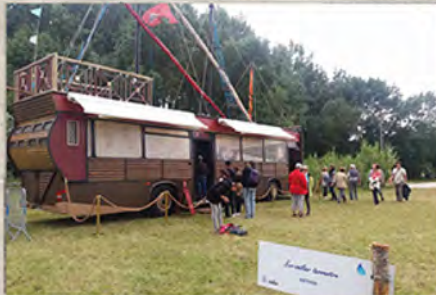
La locovillier de l'association Artyka n'est pas passé inaperçu. Une invention originale et ludique.

Malgré une météo capricieuse, près de 5.000 personnes ont participé au Break d'été de la Gloriette, et redécouvert le parc via le thème des quatre éléments.