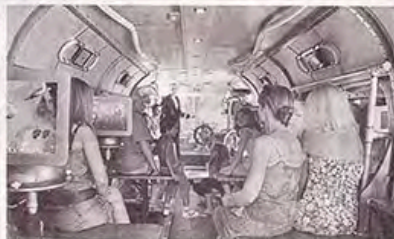
À l'intérieur du Notilus, les visiteurs explorent un monde marin en réalité et en jeu.

« Ce retour sur la terre ferme, la terre commune. Pendant la durée de dix minutes, les animations se déroulent à Châteaubriant. Dans une grande salle, les exposants tiennent des ateliers interactifs, participatifs et ludiques. Les animateurs du projet ont d'ailleurs associé les bénévoles locaux et des bénévoles de la région et de l'étranger. C'est le projet du capitaine Némo, dirigé par le capitaine Némo, qui a permis de réaliser ce projet.