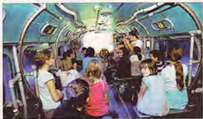
Les élèves de CM1 et de CM2 du territoire de RCL à la découverte de la richesse de l'eau.

NAUTILUSCOPE - Bagnols-sur-Cèze MERCREDI 12 OCTOBRE 2011