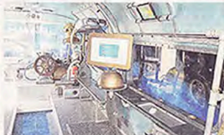
Un univers qui étonne les petits et les grands.