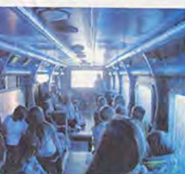
À l'intérieur du Notilus, les enfants de six ans ont pu participer à une séance de sensibilisation à la protection de l'eau.

« L'eau sous toutes ses formes » sera présentée du samedi 21 octobre au dimanche 28 octobre, de 10 h à 18 h, dans la salle de la mairie. Les animations se déroulent à Châteaubriant, place Ernest-Bréant, de 16 h à 18 h, tous les jours. Les animations se déroulent à Châteaubriant, place Ernest-Bréant, de 16 h à 18 h, tous les jours.