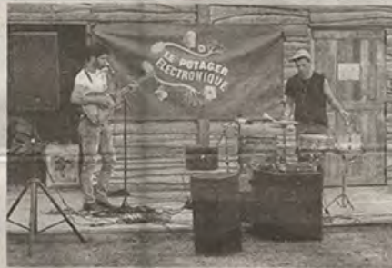
Le festival du Potager électronique a été couplé au Break d'été de la Gloriette cette année.

ron, chargée de la programmation. Les visiteurs ont notamment pu flâner le long de stands d'association, s'initier au canoë-kayak, au cerf-volant... ou découvrir des métiers d'artisans (forgeron, souffleur de verre, sabotier...) grâce à des démonstrations. Une animation a particulièrement attiré le regard des