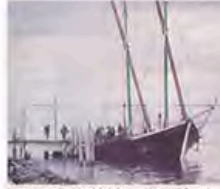
Des promeneurs à bord de la barque "La Savoir" ont pu profiter le samedi à partir du débarcadère de la CGN.

En 2004, la Ville a reçu le label "France Saites Nautique" qui lui permet de rejoindre un club de franc-tireurs membres en France. Pour conserver son statut nautique, il était également important de se mouvoir dans ce type de manifestation.