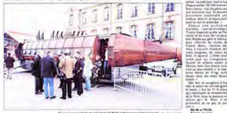
Après un court séjour au Nautilus, le Nautilus a rejoint les parents. Photo A.