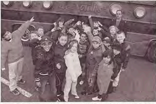
Une quinzaine de classes vont partir à la découverte des secrets de l'eau à bord du Nautilus. Photo A.

Quand un sous-marin terrestre de 15 mètres de long jette l'ancre sur le parking du collège Mermoz, forcément, cela fait parler. Ce Nautilus fait partie de l'arsenal déployé depuis hier matin en ville dans le cadre de la semaine de la citoyenneté qui concernera l'ensemble des élèves, de la maternelle au collège. L'aventure a donc commencé à bord de ce Nautilus avec l'Odyssée de l'eau. Les enfants ont été accueillis par le commandant de bord en personne qui les a fait participer à une animation capricieuse en leur dévoilant tous les secrets sur un trésor à préserver: l'eau. Pendant 45 minutes, les enfants ont été sensibilisés d'une manière ludique aux richesses de l'eau avec la projection d'un film documentaire