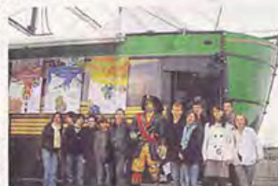
Le conseil des jeunes de la ville de Châteaubriant a participé à l'inauguration du salon de l'habitat durable et des énergies renouvelables.

Quels sont les enjeux du développement durable ? Réponses ce week-end au 2 e salon de l'habitat durable et des énergies renouvelables.