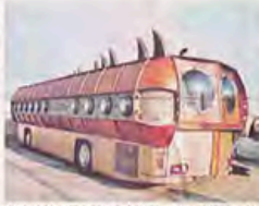
Le "Notilus" sillonne les bords de Léman pour offrir au public un petit voyage dans les fonds océaniques.