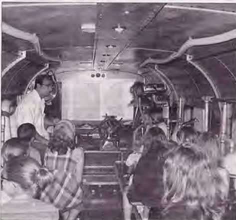
À l'aide d'un film, d'un questionnaire et d'une mini-exposition, le Capitaine Nemo sensibilise les enfants et les adultes aux enjeux du développement durable. Il est à Beaumont-le-Roger jusqu'à dimanche.