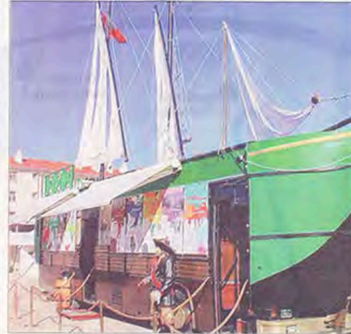
Symbole de voyages, d'aventure et de découvertes, le Galion, long de 15 m et haut de 12 m, suscite partout la curiosité des petits comme des grands.

Les CE2 des écoles primaires de la commune seront les premiers à monter à bord. Ils y apprendront beaucoup de choses sur le gaz à effet de serre, la manière d'économiser l'eau, les déchets, les économies d'énergie, les espèces animales en