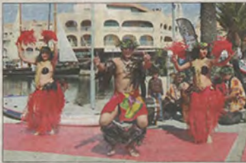
Les danseurs tahitiens du groupe Heli show tamuré assurent l'animation du port. Maeva I (bienvenue!)

D urêve, de la détente et de la découverte dans une multitude de domaines en lien avec la mer... Voilà ce que les visiteurs ont trouvé hier sur les quais du Hyères Boat Show 2016! Une 5 e édition qui a connu une très belle seconde journée et espère que le temps lui restera favorable aujourd'hui, malgré des prévisions un peu pessimistes. Qu'à cela ne tienne, il faut faire le déplacement entre deux nuages, parce le salon nautique comme l'espace Au cœur de la mer , le valent. Même si l'on n'est pas passionné de nautisme, il y a beaucoup de centres d'intérêt. De nouveaux concepts de bateaux et des innovations technologiques étonnantes, de nombreuses démonstrations à suivre, des initiations, des conférences données par des spécialistes, mais aussi des visites instructives et ludiques. Sans même parler de l'ambiance festive. Le salon dure jusqu'à lundi soir... alors rendez-vous sur les quais!