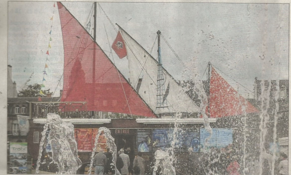
Le voilier installé place Rapp à l'occasion de la semaine de la mobilité accueille une exposition sur les menaces qui pèsent sur la planète.