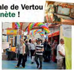
Le Galion (15 m de long et 14 m de haut) sera amarré au milieu de la Foire.

Artyka vous propose une animation originale avant tout conçue pour sensibiliser un très large public aux richesses de notre planète et au enjeu d'une gestion raisonnée. www.artyka.asso.fr