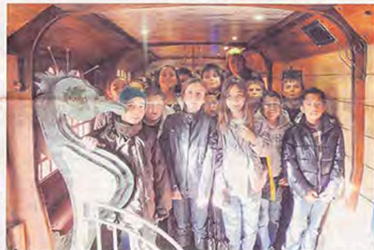
S.R. Les écoliers à bord du Gallon éco-lo... Photo S.R.