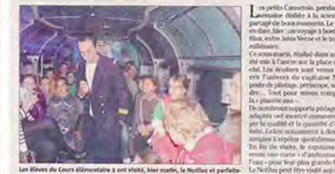
Les élèves du Cours élémentaire 2 ont visité, hier matin, le Nautilus et participé de leur mieux à la découverte de la planète eau.

Les petits Cannetois, pendant cette semaine dédiée à la science, ont participé de leur mieux. Le premier épisode, hier, un voyage à bord du Nautilus, entre Jean Verne et le troisième millénaire. Ce sous-marin, réalisé dans un bus, a été mis à l'ancre sur la place du Marché. Les écoliers ont vu découvrir l'univers du capitaine Nemo - poste de pilotage, periscopes, scaphandres - tout pour mieux comprendre la planète eau. Des ateliers supports pédagogiques adaptés ont été conçus pour garantir la qualité et la quantité d'eau potable. Grâce notamment à des gestes simples à répéter quotidiennement. En fin de visite, le capitaine Jean a remis une carte à l'ambassadeur de l'eau: « pour l'eau plus grande fleurir. Le Nautilus peut être visité jusqu'à toute la journée; entrée gratuite. J.R.