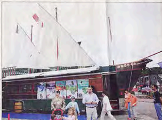
Un voilier de 15 m de long et 12 m de haut attend les moussaillons pour les sensibiliser à l'environnement.

Les responsables du centre permanent pour les initiatives pour l'environnement (CPIE) organiseront aussi une réunion dans chaque école, avec le directeur et les enseignants pour travailler sur le projet "Eco-colo" (label décerné aux écoles et