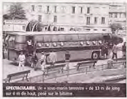
SPÉCIAL: le « sous-marin » de 13 m de long sur 4 m de haut, pour sur le bâtiment

Dans le cadre des Expositions du Parc, le Nautilus sera en immersion devant la Maison de la Pinède demain mardi 29 septembre, de 9 heures à 18h30. Les scolaires du secteur embarqueront à bord du légendaire navire de Jules Verne pour une découverte de la maison de l'eau. Au programme: film sur l'eau, quiz, jeux interactifs, quiz, etc. Embarquement immédiat dans un « sous-marin » à spectacle de 13 m de long sur 4 m de haut, pour sur le bâtiment