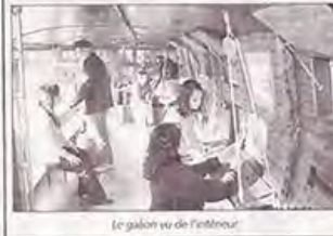
Le galion vu de l'intérieur

pédagogique aussi amusant que riche d'enseignements. Ce voilier de 12 mètres de haut et de 15 mètres de long sera posé à même le bitume! Imaginez que son équipage vous convie à monter à son bord. Symbole de voyages, d'aventures et de découvertes, ce voilier terrestre suscite la curiosité de tous, et offre la garantie d'animations attractives. Tel un pirate, les visiteurs doivent soulever des trappes, manœuvrer la barre, regarder dans une longue-vue... Chaque objet de décoration ou outil de navigation dévoile des informations parfois insolites. Le Galion est un bus itinérant qui sillonne les routes de France et qui, une fois arrivé sur le lieu de la manifestation, se transforme en voilier. Il faut environ 1h30 pour le monter. Ce défilé d'engins sera dévoilé ce matin à partir de 11 heures.