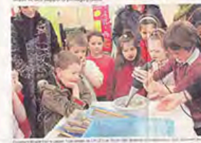
Les enfants ont participé à un atelier de sensibilisation à l'habitat durable et des énergies renouvelables.

pour petits et grands. Préservés de l'impact documentaire, les enfants ont pu découvrir les métiers de l'habitat durable et des énergies renouvelables. Les ateliers ont été animés par des professionnels du secteur.