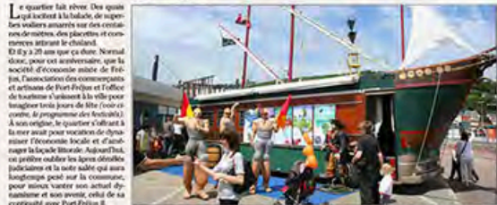
Pour les vingt ans de Port-Fréjus, une course de VTT a animé les quais. Non loin de là, un grand voilier a dévoilé des animations, avant qu'une grande parade de théâtre fasse son apparition.

Parade et planète Hier, sous un soleil de plomb, le port a pris son rythme de croisière teinté avec une exposition, des animations à bord d'un voilier, une course en VTT sur les quais pour terminer la nuit venue, des troupes de théâtre de rue. La soirée s'est terminée chaude avec un train « de planches à vol